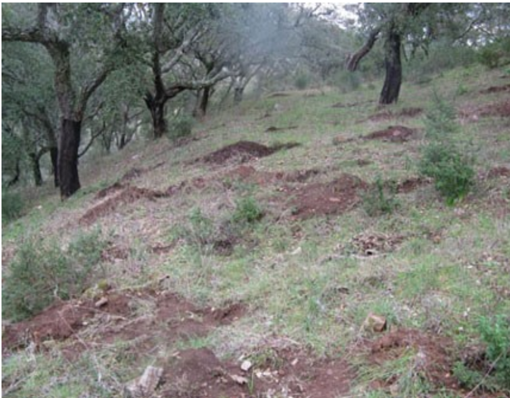
Site protohistorique de la Coroa do Frade pillé au détecteur de métaux. Plusieurs centaines de trous ont été creusés par les pilleurs, une grande partie du site est définitivement ruinée.